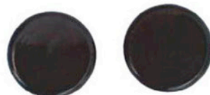
DICHTUNGSKAPPEN 2 X