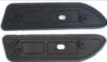
VORDERE DICHTUNGSGUMMIS 2 X