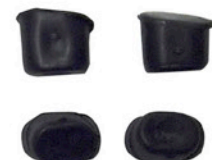
DICHTUNGSKAPPEN 4 X