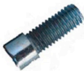
M 6 x 20 SCHRAUBEN 4 X