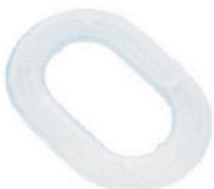
UNTERLEGSSCHEIBEN 4 X