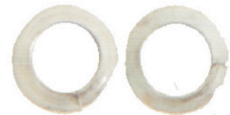
M 6 x FEDERRINGE 2 X