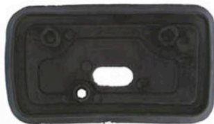
MITTLERE DICHTUNGSGUMMIS 2 X