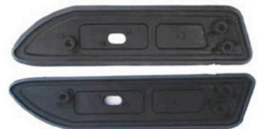
HINTERE DICHTUNGSGUMMIS 2 X