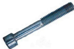
M 6 x 55 SCHRAUBEN 2 X