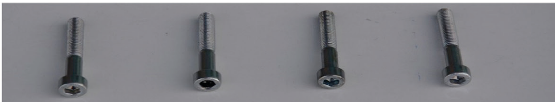
4 x SCHRAUBEN M 8 x 55