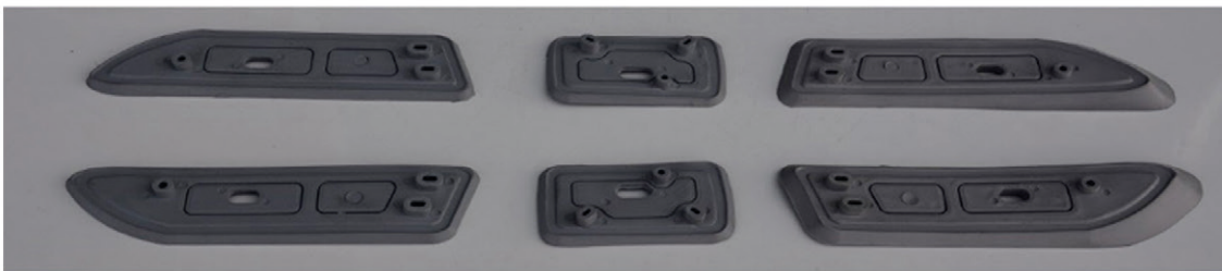
6 x DICHTUNGSGUMMIS