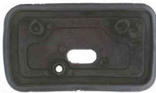
MITTLERE DICHTUNGSGUMMIS 4 X