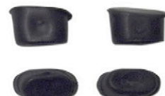
DICHTUNGSKAPPEN 4 X