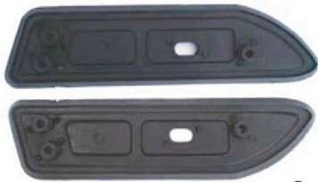
VORDERE DICHTUNGSGUMMIS 2 X