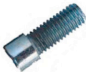
M 6 x 35 SCHRAUBEN 4 X