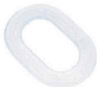
UNTERLEGSCHLEIBEN 4 X