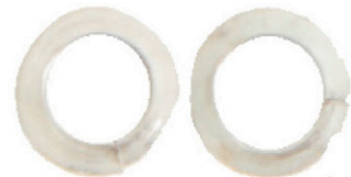
M 8 x FEDERRINGE 4 X