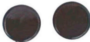
DICHTUNGSKAPPEN 2 X