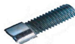
M 6 x 30 SCHRAUBEN 2 X