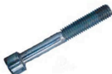
M 6 x 55 SCHRAUBEN 4 X