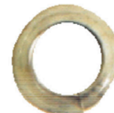
RUNDE UNTERLEGSCHIEBEN 4 X