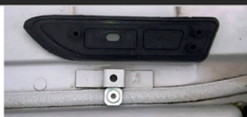
VORDERE FAHRERSEITE DICHTUNGSGUMMIS