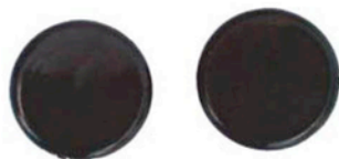
DICHTUNGSKAPPEN 4 X