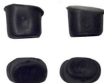
DICHTUNGSKAPPEN 4 X