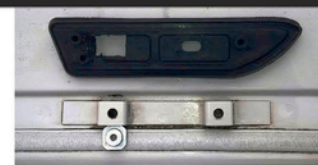
HINTERE FAHRERSEITE DICHTUNGSGUMMIS