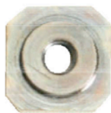
UNTERLEGMUTTER 8 X