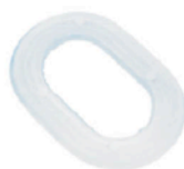
OVALE UNTERLEGSCHIEBEN 4 X