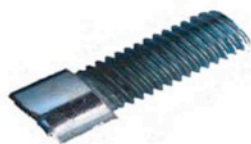
M 6 x 20 SCHRAUBEN 2 X