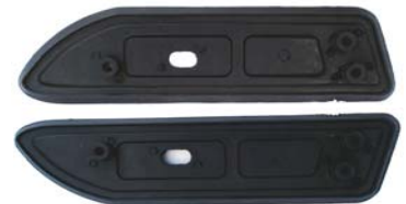
HINTERE DICHTUNGSGUMMIS 2 X