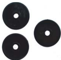
UNTERLEGSCHIEBEN 6 X