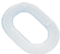
UNTERLEGSCHIEBEN 4 X