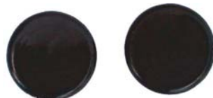
DICHTUNGSKAPPEN 2 X