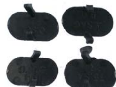
DICHTUNGSKAPPEN 4 X