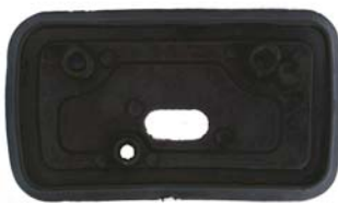
MITTLERE DICHTUNGSGUMMIS 2 X