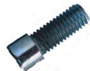
M 8 x 30 SCHRAUBEN 4 X