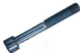
M 8 x 55 SCHRAUBEN 2 X