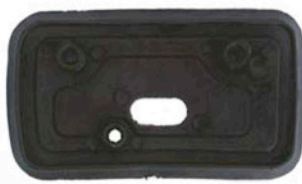
MITTLERE DICHTUNGSGUMMIS 4 X