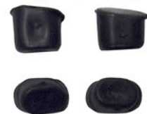
DICHTUNGSKAPPEN 4 X