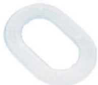
UNTERLEGSCHIEBEN 4 X