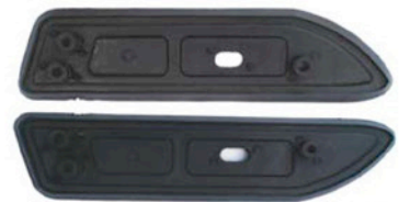
VORDERE DICHTUNGSGUMMIS 2 X