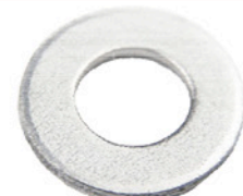
UNTERLEGSCHIEBEN 4 X