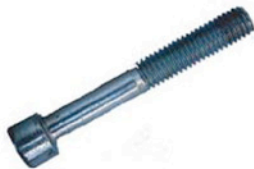
M 6 x 65 SCHRAUBEN 4 X