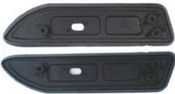
HINTERE DICHTUNGSGUMMIS 2 X