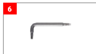
1x Torx Schlüssel (T25) 1x torque wrench (T25)