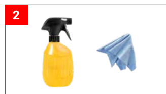
1x Reinigungsflüssigkeit und Microfasertuch 1x Cleaning Liquid or M600