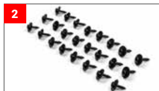
26x 4.8 Schrauben 26x 4.8 washer screw