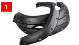
4x Kotflügelverbreiterung 4x Fender Flares