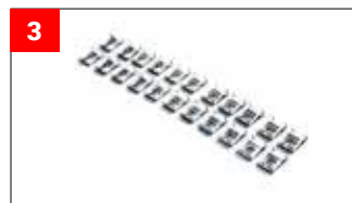
26x Federklemmen 26x Spring Clips