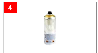
1x Schutzlackspray 1x Protector paint spray