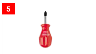
1x Schraubenzieher 1x screw driver