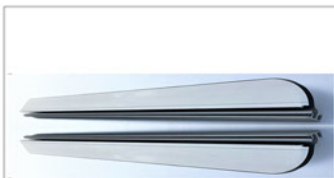
2 x Führungsschienen