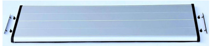
1 x Abdeckungsplatte