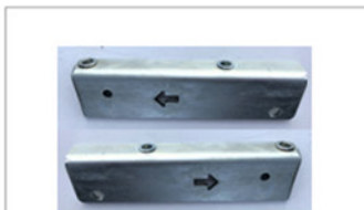
2 x Aufsatzwinkel für Laderaumabdeckung