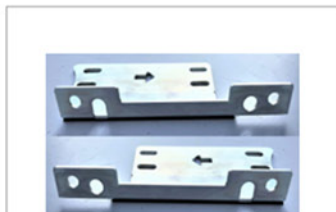
2 x Abdeckaufsatzwinkel