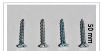
4x 50mm Schrauben für die Kantenleiste