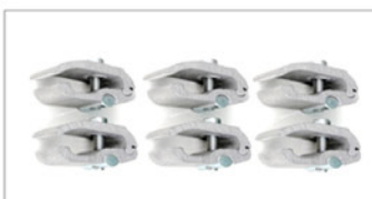
6 x Spezialschrauben