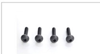
8 x 8mm Schrauben (für Kasten, Überrollbügel vorne und hinten)