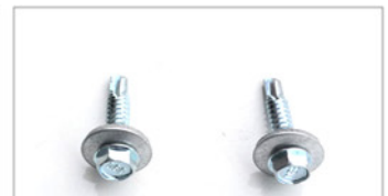
2 x M6 selbstschneidende Schrauben für den Aufsatzwinkel