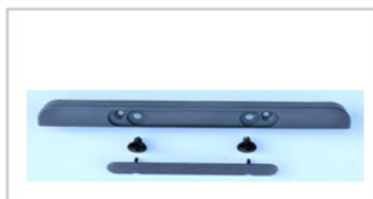
Abdeckkappen / Kantenleiste