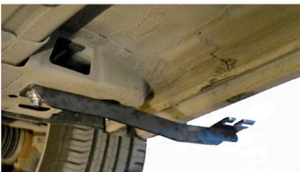
5) Schrauben Sie wie dargestellt die Halterungen rechts am Auto. Ziehen Sie die Schrauben nicht zu fest an, erst am Ende.