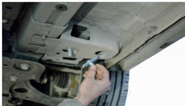
2) Setzen Sie hier die Spezialschrauben in T-Form ein.