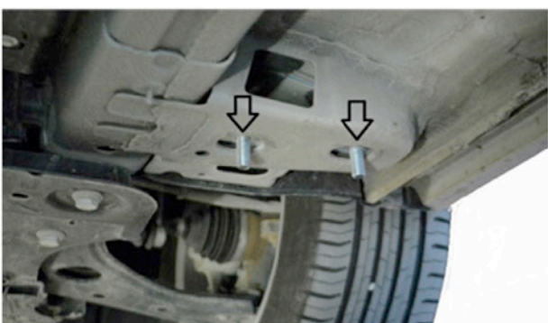
3) So müsste es aussehen und wäre für die Montage bereit.