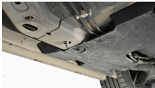
4) Hier sehen Sie die Hinteren Verschraubungspunkte, setzen Sie dort die M10 in L-Form ein.