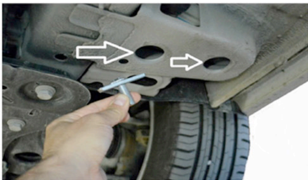
1) Vordere Verschraubungspunkte.