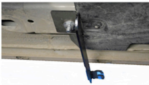
6) Schrauben Sie hinten rechts am Auto die nächste Halterung.