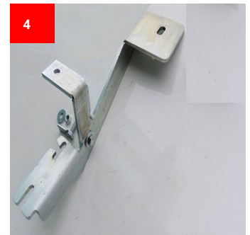
4 1x Hinten Rechts 1x Back Right