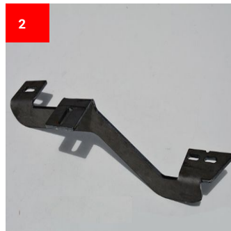
2 1x Vorne Links 1x Front Left