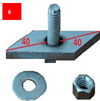
6 2x M12 Trapezschaube 2x M12 Trapezoidal screw