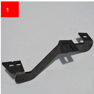
1 1x Vorne Rechts 1x Front Right