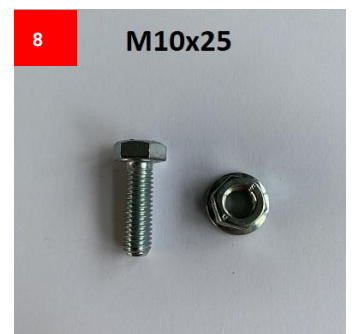
8 M10x25 10x M8 Schrauben 10x M8 Screws