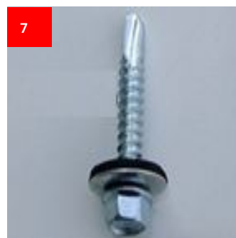
7 2x Selbstschneidene Schraube 2x Self-tapping screw