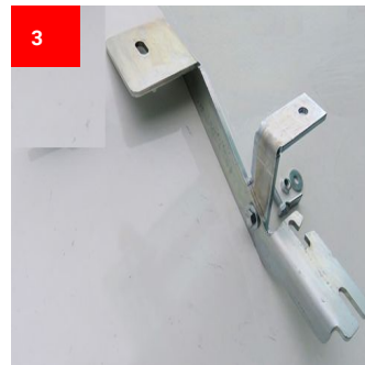
3 1x Hinten Links 1x Back Left