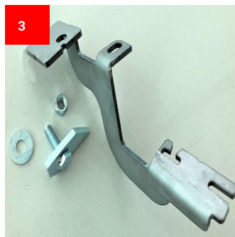
1x Hinten Rechts 1x Back Right