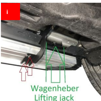
Wagenheber Lifting jack

Befestigen Sie das Trittbrett Attach the footboard