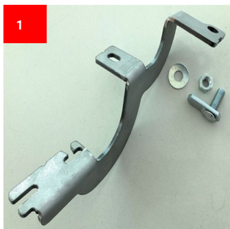
1x Vorne Rechts 1x Front Right