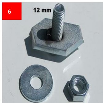
2x M12 Spezialschraube 2x M12 Sepcial screw