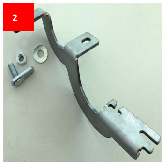
1x Vorne Links 1x Front Left