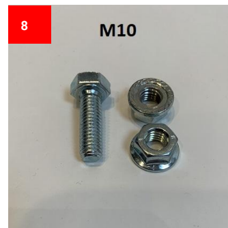
8x M10 Schraube 8x M10 Screw