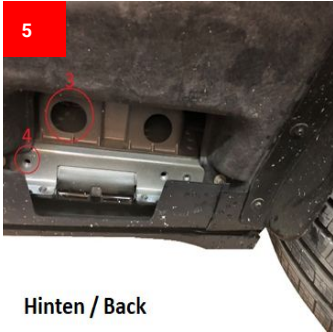
Hinten / Back

Befestigen Sie den Halter Attach the holder