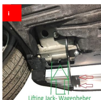
Lifting Jack- Wagenheber