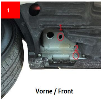
Vorne / Front

Befestigungspunkte Vorne Attachment points front