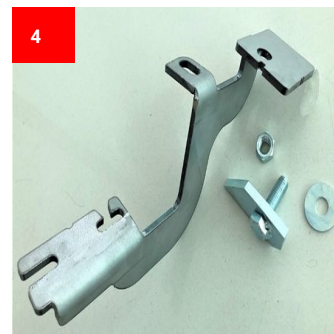
1x Hinten Links 1x Back Left