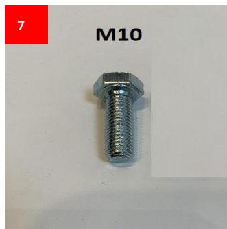
4x M10 Schraube 4x M10 Screw