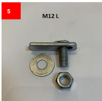
2x M12 T Schraube 2x M12 T Screw