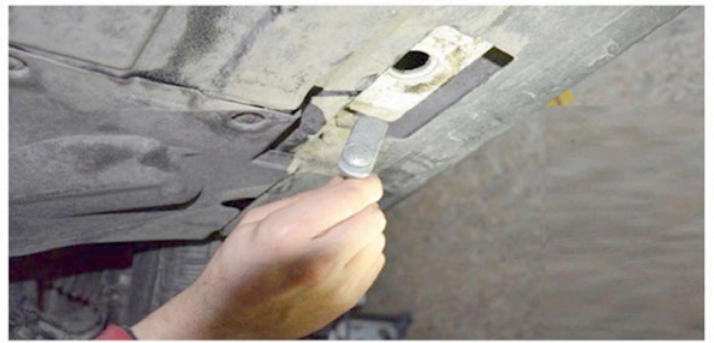
2) Setzen Sie nun die Schrauben in L-Form ein.