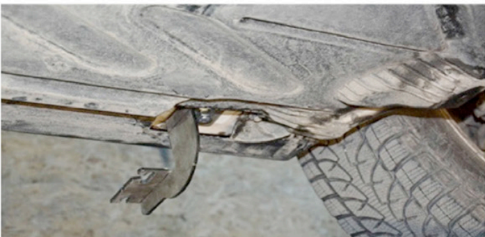
5) Befestigen Sie auch die hinteren Halterungen genau wie vorne am Fahrzeug.