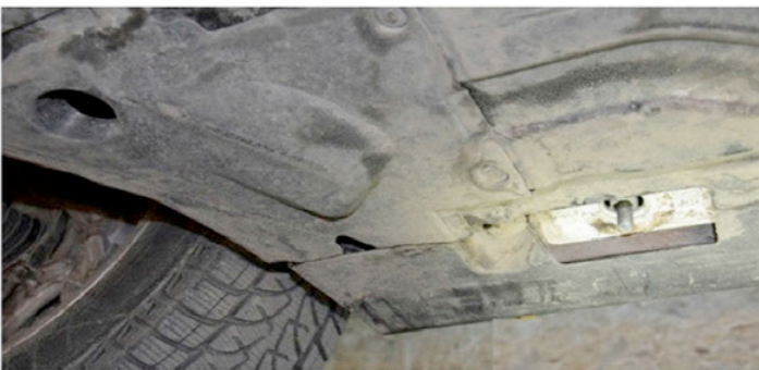
3) So müsste es aussehen und wäre somit bereit zur Montage.