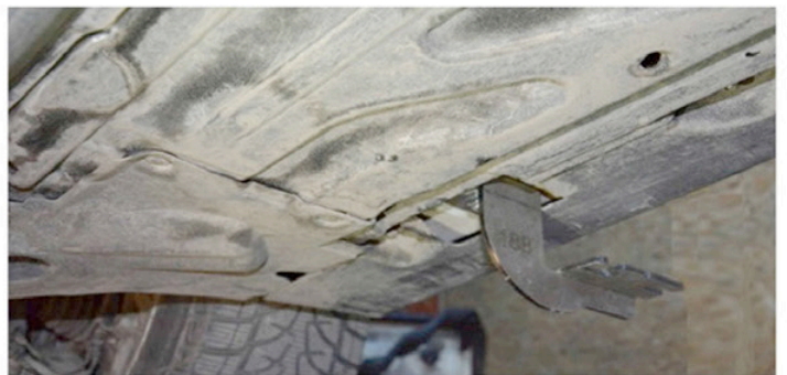
4) Setzen Sie nun vorne am Fahrzeug die Halterungen ein und befestigen Sie diese mit den M10 Schrauben.