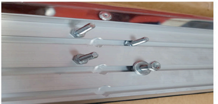
6) Führen Sie unter die Trittbretter die M8 Schrauben ein.