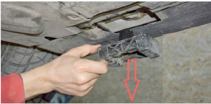
1) Nehmen Sie alle 4 Gummiklötze ab so wie im Bild dargestellt.