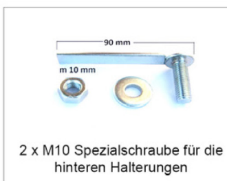
2 x M10 Spezialschraube für die hinteren Halterungen