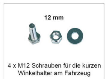
4 x M12 Schrauben für die kurzen Winkelhalter am Fahrzeug