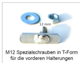
M12 Spezialschrauben in T-Form für die vorderen Halterungen