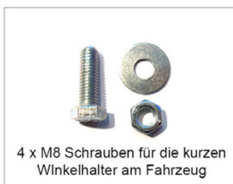
4 x M8 Schrauben für die kurzen Winkelhalter am Fahrzeug