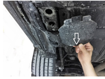
7) Entfernen Sie Hinten die Kunststoffschutzverkleidung.