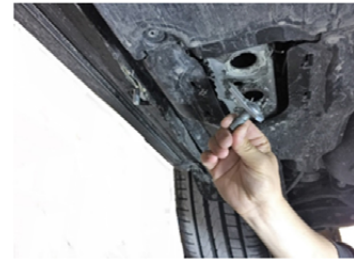
11) Setzen Sie die M12 Spezialschraube ein.