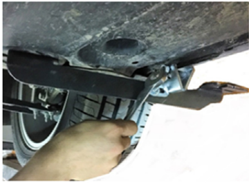
5) Um den Halter auszurichten, setzen Sie die Spezialklammer an.