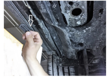
8) Entfernen Sie den Stopfen