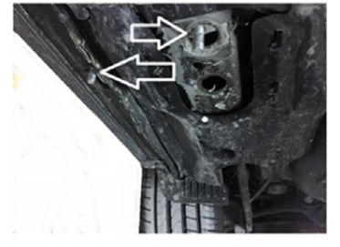
12) Bereit zur Montage der Halterung.