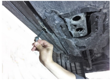
10) Setzen Sie die M10 Spezialschraube in L-Form ein