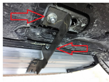
15) Wenn Sie das Trittbrett ausgerichtet haben, ziehen Sie alle Schrauben fest an.