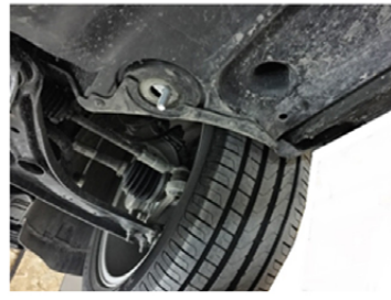
3) So sollte es aussehen.