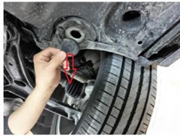
2) Setzen Sie die M 12 Schrauben in L-Form ein.