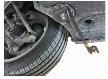
4) Wie im Bild dargestellt, verschrauben Sie die Halterung.