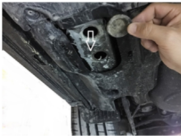
9) Auch hier die Stopfen entfernen.