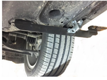
6) So ist es bereit zu Montage der Trittbretter.