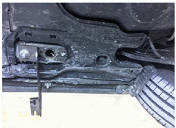
13) So ist die Halterung richtig montiert.