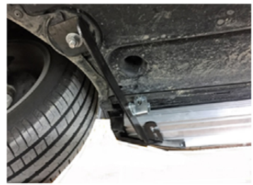
14) Setzen Sie das Brett auf die Halter auf und verschrauben diese.