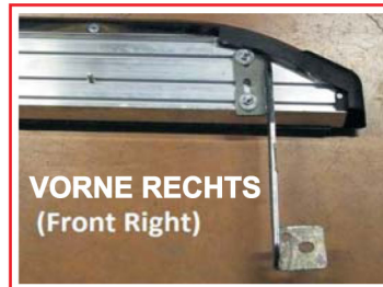
VORNE RECHTS (Front Right)

Bevor Sie alle Schrauben am Fahrzeug und auf dem Trittleisten festziehen sollten Sie darauf achten das die Trittleisten horizontal und vertikal zum Fahrzeug ausgerichtet ist. Erst dann die Schrauben fest anziehen.